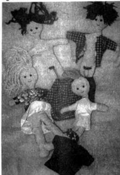
Anatomické panenky používané v diagnostice sexuálně zneužívaných dětí